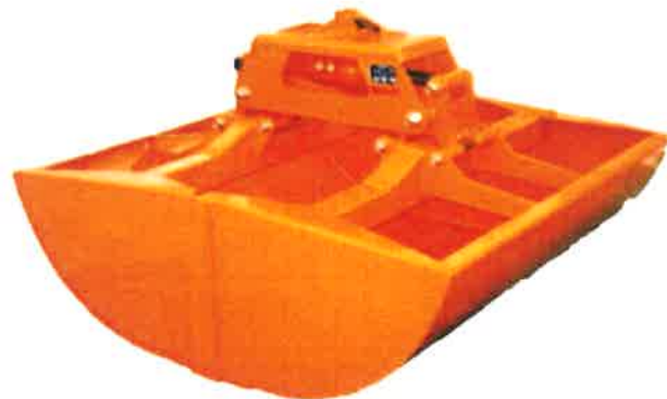
Korngrab KG 90-1000

Alle bevægelige punkter er forsynet med effektiv smøring samt udskiftelige lejer, hvilket gør evt. senere vedligeholdelse og reparation let, hurtigt og pris billigt.